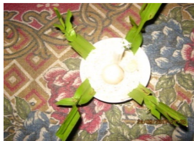
Gambar 5. Tepung Tawar

Tipong tawar berguna untuk menawarkan atau untuk membuang naas, kecerobohan yang tidak terasa terucap oleh peserta penugal dan penias dan kejadian lainnya.