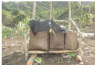
Gambar 4. Tenian (tempat padi)