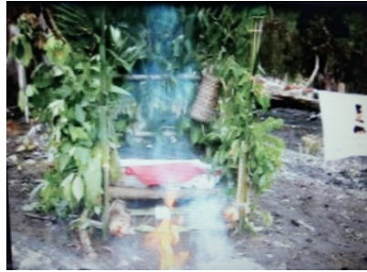
Gambar 3. Tenian (tempat padi)