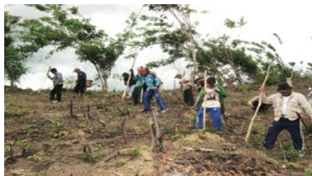
Gambar 1. Kegiatan Nasok

Kegiatan Nasok adalah salah satu kegiatan yang menggunakan kayu yang diruncingkan sebagai alat tugalan untuk membuat lubang yang akan didisi benih padi. Kegiatan ini dilakukan oleh para bapak, para remaja putra, para anak lelaki dengan berdiri dan berderet ke arah samping kiri dari seseorang yang bertugas Moit Wae , ia berhak untuk mengatur luas yang ditugal (dibuat lubang) dalam satu kali gerak naik-turun juga disesuaikan dengan jumlah peserta penugal, bergerak ke arah depan, samping kiri dan kanan untuk membantu teman yang ada di kiri dan kanan.