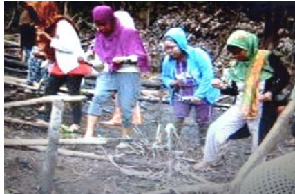
Gambar 2. Kegiatan Nias

Kegiatan nias adalah suatu kegiatan mengisi benih padi ke dalam lubang tugal yang dilakukan oleh para ibu, para remaja putri, dan anak-anak dengan membawa peruan penias sebagai tempat padi yang diambil dari seseorang yang disebut ine pare (ibu padi), dia bertugas untuk mengambil dan membawa padi dari tenian yang akan diberikan atau dibagikan kepada anggota penias .