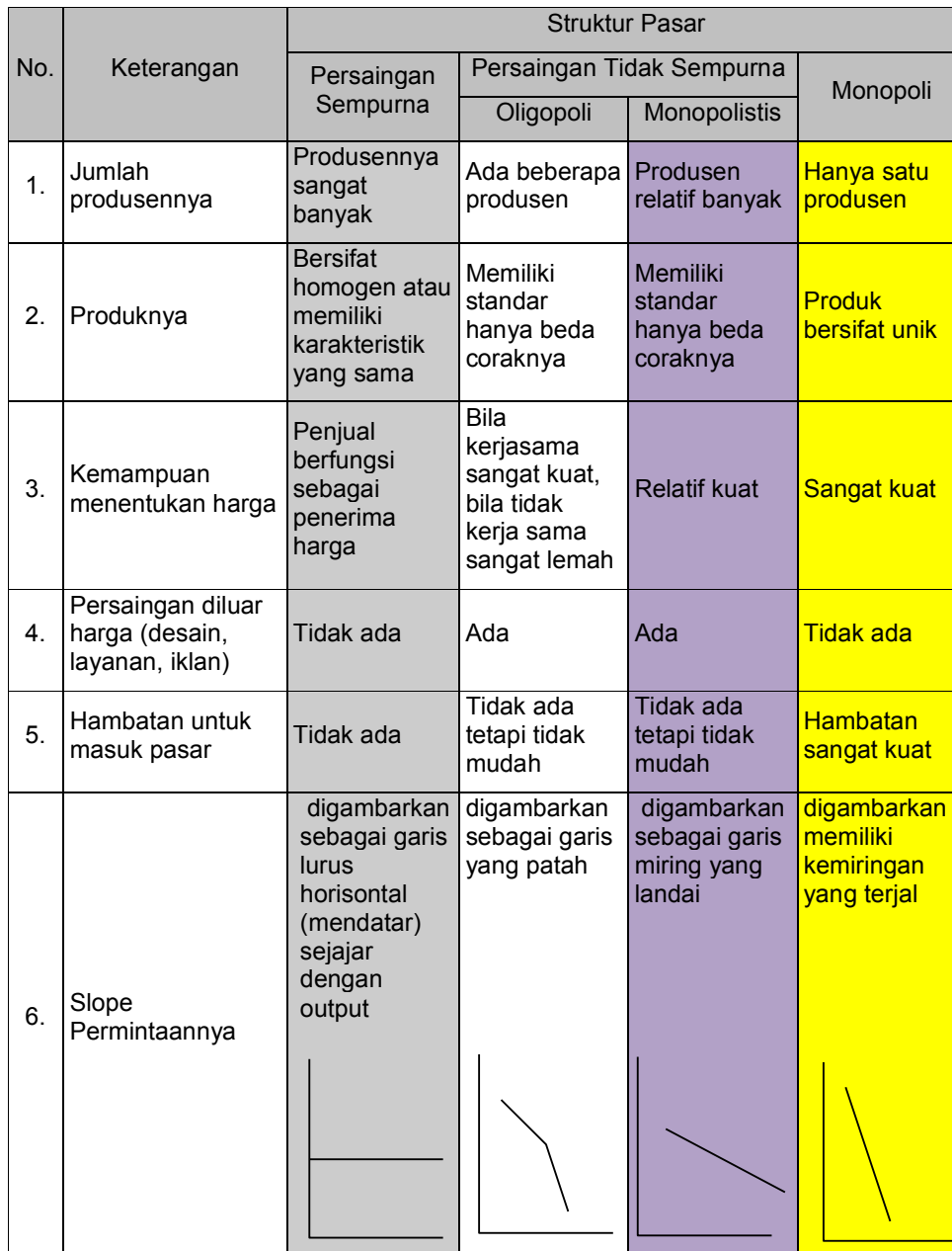
Tabel 1. Perbedaan karakteristik empat struktur pasar