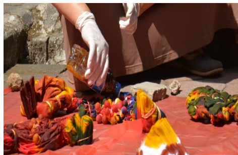
Gambar 4. Pemberian Pewarna dalam Membatik Shibori