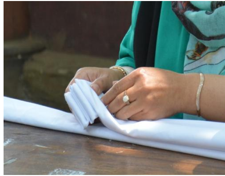
Gambar 3. Memberi Ikatan dalam Membatik Shibori