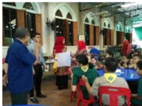
Gambar 2. Kegiatan Membatik Shibori