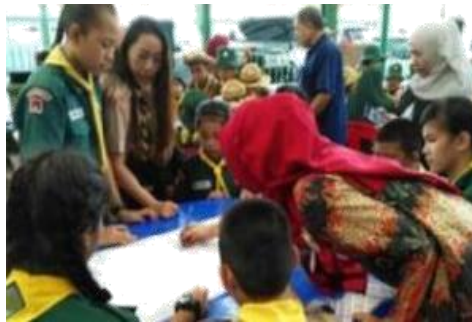
Gambar 1. Kegiatan Sosialisasi Pengenalan Membuat Shibori

Shibori merupakan salah satu kesenian yang berasal dari Jepang. Shibori berasal dari kata kerja “shiboru” yaitu teknik pewarnaan kain yang mengandalkan ikatan dan celupan. Batik Shibori merupakan sebuah pola dalam kain yang diciptakan melalui suatu proses pencelupan dengan pewarna. Pembuatan motif batik Shiboritak jauh beda dengan batik (meskipun dari segi pengerjaan jauh lebih mudah dan lebih sederhana). Melihat dari daerah asalnya tak heran aliran batik ini acapkali disebut dengan batik asal Jepang.