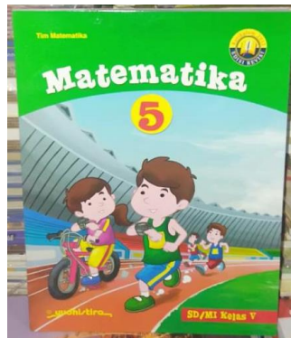
Gambar 1. Cover Buku terbitan dari Yudistira Edisi Revisi “Matematika 5”

Analisis yang dilakukan terhadap bahan ajar Buku terbitan dari Yudistira Edisi Revisi Matematika 5 berdasarkan kajian teori terhadap komponen-komponen bahan ajar dari Depdikbud (2008). Adapun hasil analisis bahan ajar tersebut disajikan sebagai berikut.