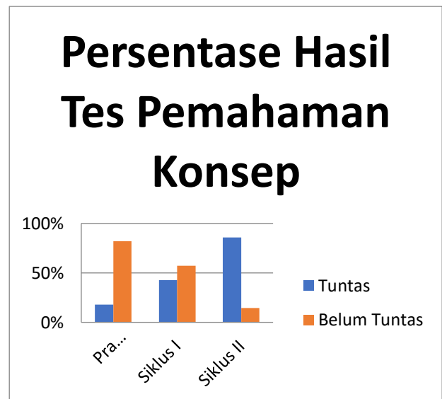
Gambar 1. Hasil Tes Pemahaman Konsep

lebih jelasnya peningkatan pemahaman konsep siswa dapat dilihat pada gambar 1.