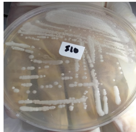
Gambar 1. Hasil makroskopis Jamur Candida sp. pada media Sabouraud Dextrose Agar (SDA)

Identifikasi jamur Candida sp secara makroskopis dan mikroskopis pada 30 sampel urine pada penderita infeksi saluran kemih di dapatkan hasil 9 sampel positif adanya pertumbuhan jamur Candida sp dan 21 sampel negatif tidak terdapat pertumbuhan jamur Candida sp.