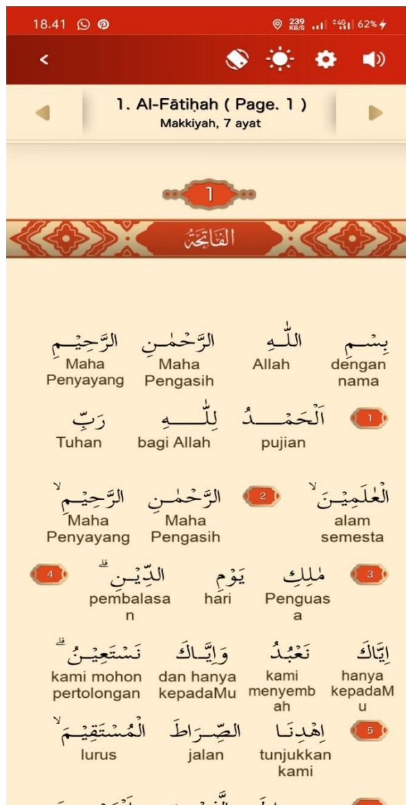
Gambar 4. Tampilan Ayat

dan My Doa, yang berisi kumpulan doa Islami. Selain itu, ada fitur Konten Islami yang menawarkan materi Islami, MyQuran EDU, yang menawarkan pembelajaran interaktif Al-Qur'an, dan Hafalan, yang dirancang untuk membantu pengguna menghafal ayat. Selain itu, aplikasi ini memiliki fitur yang mendukung kebutuhan sehari-hari Anda, seperti kalkulator zakat, jadwal sholat, arah Kiblat, dan tasbeih digital. Selain itu, fitur seperti Masjid Terdekat yang memperkaya pengalaman keislaman digital, Makkah Live yang memungkinkan pengguna menyaksikan siaran langsung dari Makkah, dan Asbabun Nuzul yang menjelaskan bagaimana ayat-ayat Al-Qur'an muncul. Dengan tambahan ini, MyQuran tidak hanya menjadi alat untuk mempelajari Al-Qur'an, tetapi juga