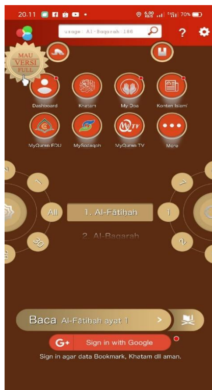
Gambar 2. Tampilan Halaman Utama Myquran

Gambar 1. Menunjukkan tampilan yang ada pada play store di smartphone android. Aplikasi dapat di download secara gratis.dengan begitu mudahnya mengakses aplikasi tersebut dapat mempermudah kita untuk menggunakannya.