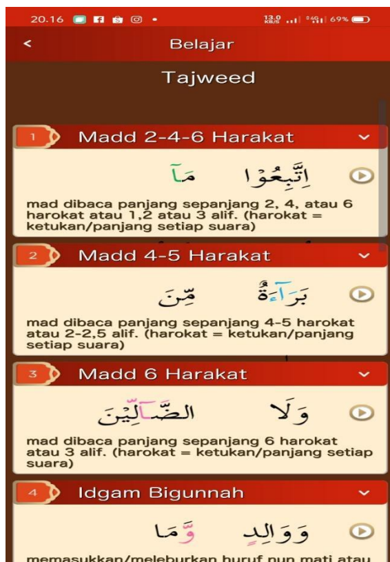
Gambar 6. Tampilan Tajwid

visual. Setiap entri ditampilkan pada latar belakang merah gelap yang seragam dengan garis pembatas yang memberikan struktur yang terorganisir.