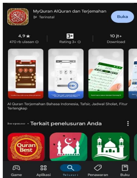
Gambar 1. Tampilan Aplikasi Myquran

Gambar 1. Menunjukkan tampilan yang ada pada play store di smartphone android. Aplikasi dapat di download secara gratis.dengan begitu mudahnya mengakses aplikasi tersebut dapat mempermudah kita untuk menggunakannya.