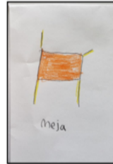
Gambar 3. ECLP sebelum adaptasi

Di tingkat lebih tinggi, guru melatih siswa dengan menggunakan strategi Menulis Mandiri, salah satu