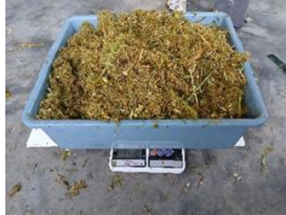
Gambar 2. Hasil pencacahan rumput odot