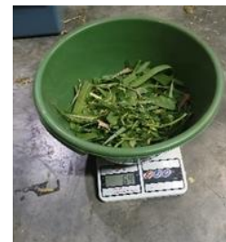
Gambar 5. Hasil pengujian manual rumput torpedo

Berdasarkan hasil perhitungan dan pengujian, mesin pencacah rumput yang dirancang mampu bekerja secara optimal. (Prapti Ningsih, 2022) Sistem transmisi menghasilkan putaran poros yang sesuai untuk proses pencacahan, sementara pemilihan poros dan bantalan telah memenuhi aspek kekuatan dan keamanan. Kapasitas pencacahan yang tinggi serta hasil cacahan yang relatif seragam menunjukkan bahwa mesin ini efektif meningkatkan efisiensi kerja peternak kambing (Sari, N., 2018)