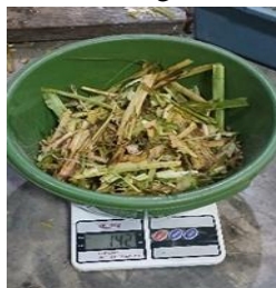
Gambar 4. Hasil pengujian manual rumput odot

Sebagai pembandingan, dilakukan pencacahan secara manual menggunakan pisau. Hasil pencacahan manual pada rumput odot hanya mencapai 142 g/menit, sedangkan pada rumput torpedo sebesar 64 g/menit.