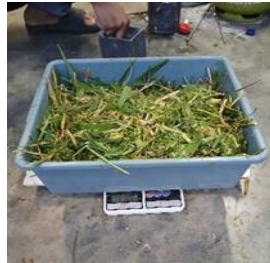
Gambar 3. Hasil pencacahan rumput torpedo