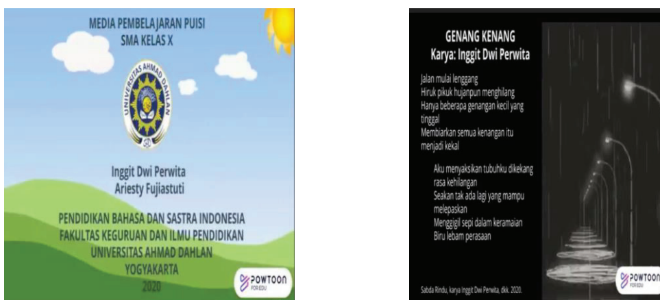
Gambar 1. Cover dan materi

indikator pencapaian kompetensi, dan tujuan pembelajaran ditulis agar peserta didik mengetahui apa saja capaian yang akan dicapai setelah mereka mempelajari materi tersebut. Contoh puisi yang dianalisis sesuai dengan unsur pembangun puisi. Dalam media pembelajaran berbasis Powtoon ini digunakan dalam 2 pertemuan. Pertemuan pertama yakni penjelasan materi unsur pembangun puisi terdapat 1 contoh puisi kemudian peserta didik diminta untuk menganalisis sesuai dengan unsur pembangun puisi. Pada pertemuan kedua terdapat penjelasan materi tentang menulis puisi kemudian peserta didik diminta untuk menulis puisi sesuai dengan perasaan/peristiwa yang pernah terjadi dalam kehidupannya. Soal latihan dan evaluasi digunakan untuk mengukur kemampuan peserta didik. Berikut adalah contoh cover dan gambar dalam media.