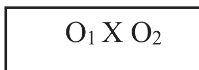
Gambar 3.1. One-Group Pretest-Posttest Design

Dengan demikian hasil perlakuan/ treatment dapat diketahui lebih akurat, karena dapat membandingkan dengan keadaan sebelum diberi perlakuan. Adapun desain One-Group Pretest-Posttest Design dapat digambarkan seperti berikut :