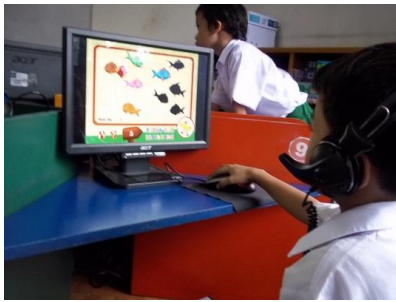
Gambar 1: anak bermain komputer dalam pengembangan kognitif

Menurut Direktorat Jenderal Pendidikan Anak Usia Dini, non formal dan informal (2012:5) Pendidikan karakter merupakan pendidikan yang melibatkan penanaman pengetahuan, kecintaan dan penanaman perilaku kebaikan yang menjadi sebuah pola/kebiasaan. Pendidikan karakter tidak lepas dari nilai-nilai dasar yang dipandang baik. Salah satu nilai karakter yang dapat dikembangkan dalam pendidikan anak usia dini adalah karakter kreatif.