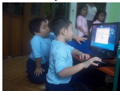
Gambar 4: bermain komputer menumbuhkan sikap positif

Para pakar menyatakan bermain komputer dapat memberikan nilai positif bagi perkembangan anak. Menurut Conny R Semiawan (2008:55), penggunaan komputer dapat meningkatkan inteligensi anak, karena dorongan rasa ingin tahu anak yang tinggi (rasa ingin tahu adalah sifat khas manusia). Selain itu, kecepatan, kecermatan, keterkinian informasi dapat diperoleh melalui komputer. Dengan demikian terjadi pengayaan fungsi otak, yang pada gilirannya meningkatkan produksi sel neuroglial yaitu sel khusus yang mengelilingi sel neuron , sehingga akan menambah jumlah sel neuron .