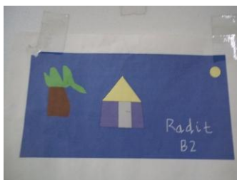
Gambar 3: Hasil karya anak dalam bentuk print out

Menurut Morrison (2004:374) penggunaan teknologi komputer di rumah maupun di sekolah sangat baik untuk perkembangan anak usia dini. Anak sekarang merupakan generasi teknologi ( digital age/digital citizen ). Anak tumbuh dan berkembang dipengaruhi oleh melalui interaksi mereka dengan teknologi. Berbagai aplikasi permainan yang menarik dapat disediakan dan tentunya menyenangkan bagi anak. Bahkan, bayi usia sembilan bulan saja sudah berinteraksi dengan komputer, saat duduk di pangkuan orang tuanya. Hal ini merupakan fakta penting bahwa anak-anak secara langsung sudah belajar dari komputer tersebut. Alat-alat tersebut dapat dimanfaatkan secara maksimal untuk melakukan proses pembelajaran di kelas, sentra dan berbagai aktivitas.