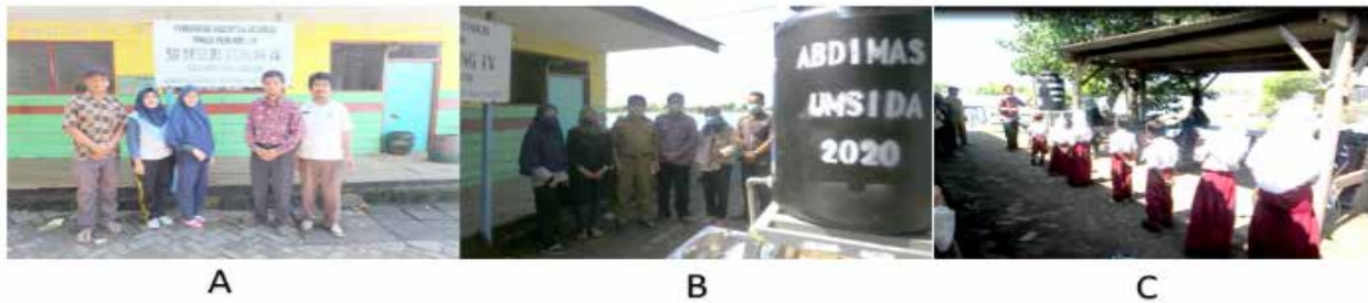
Gambar 2. Aktifitas Pengabdian Masyarakat di SDN 4 Kupang

Ket. A. Pembimbingan kepada guru dan diskusi kesiapan sekolah B. Serah terima fasilitas C. Pembimbingan siswa untuk mempersiapkan diri untuk menghadapi Kehidupan Baru ( New Normal )