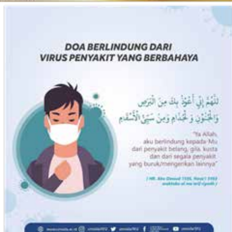
Gambar 3. Stiker/ plakat untuk sosialisasi kepada siswa