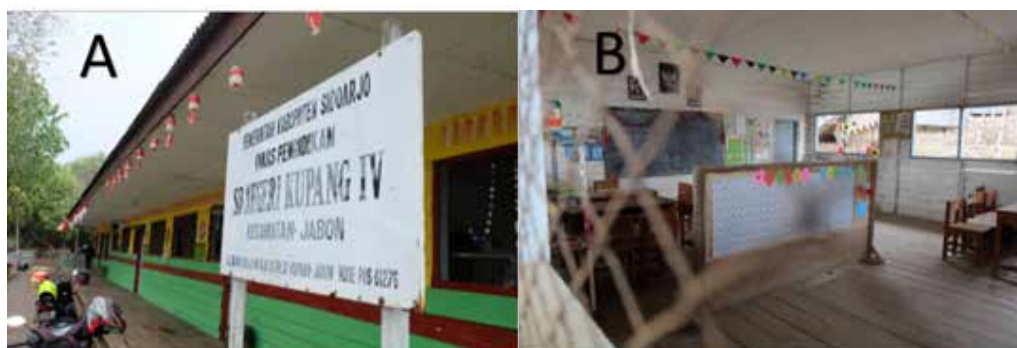
Gambar 1. Hasil Survei Lokasi Pengabdian Masyarakat. A. Bentuk fisik sekolah B. Ruang kelas yang disekat menjadi dua kelas

Sebelum kegiatan dimulai, tahapan perencanaan kegiatan dimulai dengan bekerja sama dengan pihak sekolah dan pemerintah Desa setempat. Hal itu dilakukan untuk mengetahui gambaran keadaan sekolah sehingga kegiatan yang dilakukan dapat berjalan dan sesuai dengan target. Program mulai berjalan secara efektif dari bulan Mei sampai dengan bulan Juli.