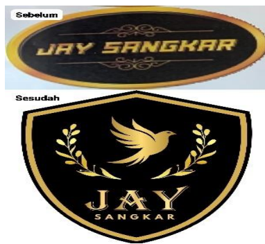
Gambar 4. Logo Lama vs Logo Baru

Adapun Perbandingan Logo Lama dan Logo Baru. Sebelum pelaksanaan program pengabdian, UMKM Jay Sangkar menggunakan logo yang sangat sederhana, hanya berupa teks bertuliskan “Jay Sangkar” dengan warna hitam polos tanpa ornamen atau elemen grafis pendukung. Tampilan tersebut tidak memiliki daya tarik visual dan belum mampu merepresentasikan karakter produk maupun nilai estetika yang menjadi keunggulan sangkar burung buatan Desa Selorejo. Akibatnya, logo lama kurang menonjol di mata konsumen dan sulit diingat.