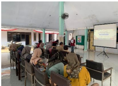
Gambar 2. Sosialisasi Branding UMKM

anggota UMKM mengenai pentingnya digitalisasi (Suminar et al., 2023), manfaat pembaruan logo sebagai identitas visual, serta optimalisasi Google Maps untuk meningkatkan visibilitas usaha. Sosialisasi ini juga mencakup strategi perawatan profil Google Maps dan pembaruan informasi secara berkala.