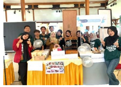
Gambar 3. Pameran UMKM Jay Sangkar

Upaya penguatan merek dan perluasan jangkauan pemasaran sejalan dengan temuan (Dimas Aditya Pratama, 2023) yang menegaskan bahwa kemasan visual dan strategi promosi yang tepat dapat meningkatkan daya saing serta respons positif dari konsumen.