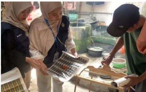
Gambar 1. Observasi UMKM

bersama pemilik UMKM untuk menggali karakter usaha, nilai unik, serta ciri khas produk sangkar burung “Jay Sangkar”. Analisis meliputi identifikasi target pasar, gaya desain sangkar, bahan baku, serta keunggulan kompetitif yang dimiliki. Hasil analisis digunakan sebagai dasar penyusunan konsep logo dan strategi promosi (Alna et al., 2024).