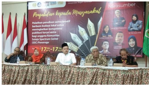
Gambar 2. Pembukaan Pelatihan Bisnis Sastra Digital bagi Anggota Komunitas SSC Ponorogo