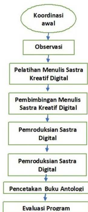
Bagan 1. Metode Pelaksanaan Pengabdian