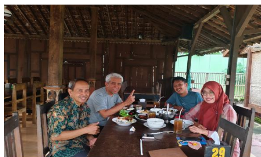
Gambar 1. Rapat Koordinasi Tim PKM SAU Unesa dengan Pengurus SSC Ponorogo

Kegiatan pelatihan penulisan sastra kreatif berbasis budaya lokal untuk meningkatkan kompetensi publikasi karya sastra bagi anggota komunitas Sutejo Spectrum Center (SSC) Ponorogo, menjadikan komunitas SSC Ponorogo sebagai mitra. Koordinasi awal dilakukan pada Februari 2025 di Rumah Makan Istana Lesehan, Jeruk Sing, Ponorogo. Mitra bersama tim pengabdian masyarakat menyepakati produk yang dihasilkan dari pelatihan penulisan sastra digital berupa antologi cerita pendek yang dicetak.