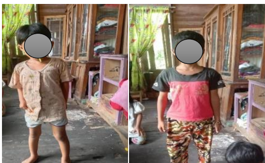
Gambar 2. Anak Stunting di Desa Lela

Penanggulangan masalah stunting yang ada di desa tersebut belum menjadi program yang diprioritaskan oleh aparat desa. Padahal masalah stunting sudah dikatakan sebagai masalah gizi terburuk yang ada di dunia. Di sisi lain, kepercayaan masyarakat yang kental terhadap budaya maupun interpretasi nilai agama masih menjadi acuan yang sering dipakai oleh masyarakat dibandingkan mengikuti kegiatan posyandu.