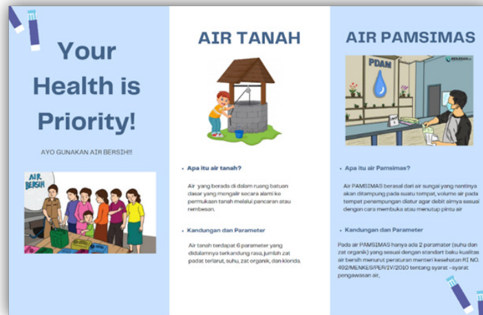
Gambar 1: Brosur Sosialisasi Penggunaan air bersih