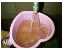
Gambar 1.1 Air Keruh

Menurut surat yang dikeluarkan Kemenkes RI No. 492/MENKES/PER/IV/2010 pada parameter warna kandungan optimal yang dianjurkan adalah 15 TCU (Ameilia et al., 2018). Dari hasil penelitian kandungan hasil uji air di Dukuh Sutorejo, Kecamatan Mulyorejo, Surabaya Air PAMSIMAS memenuhi standart sebagai air yang layak dikonsumsi. Pada parameter warna batas kandungan optimal yang diperbolehkan adalah 50 TCU. Dari hasil penelitian hasil uji air di Dukuh Sutorejo, Kecamatan Mulyorejo, Surabaya memenuhi standart sebagai sumber air baku, dengan kandungan hasil uji air tanah 1 TCU, kandungan hasil uji air PAMSIMAS 2 TCU