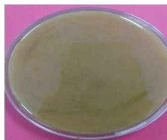
Gambar 4. Konsentrasi 50% (tidak terdapat koloni mikroba)