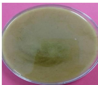
Gambar 5. Konsentrasi 75% (Tidak terdapat koloni mikroba)