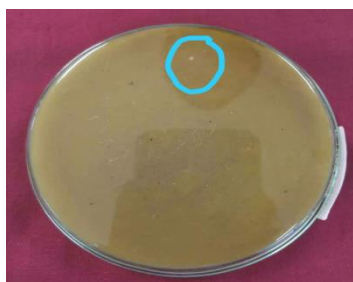
Gambar 3. Konsentrasi 25% terdapat 1 koloni mikroba yang tumbuh