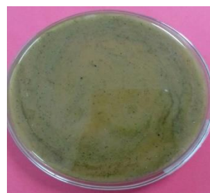
Gambar 6. Konsentrasi 100% (Tidak terdapat koloni mikroba)

Penelitian ini dilakukan untuk menguji daya antimikroba dari berbagai konsentrasi ekstrak daun kenikir ( Cosmos caudatus ) 100%, 75%, 50% dan 25% terhadap mikroba mulut. Hasil analisis uji Kruskal Wallis menunjukkan bahwa terdapat perbedaan daya antimikroba dari berbagai konsentrasi ekstrak daun kenikir dengan signifikansi ( \rho ) < 0,05 yaitu sebesar 0,003. Daya antimikroba yang diukur berdasarkan mikroba yang tumbuh. Jumlah mikroba yang tumbuh setelah 24 jam pada P1 (100%), P2 (75%), P3 (50%), P4 (25%), P5(Kontrol Positif/Listerin) dan P6 (Kontrol Negatif/Aquades), secara berurutan adalah sebagai berikut: (0), (0), (0), (25), (25) dan (3,225 \cdot 10^4) .