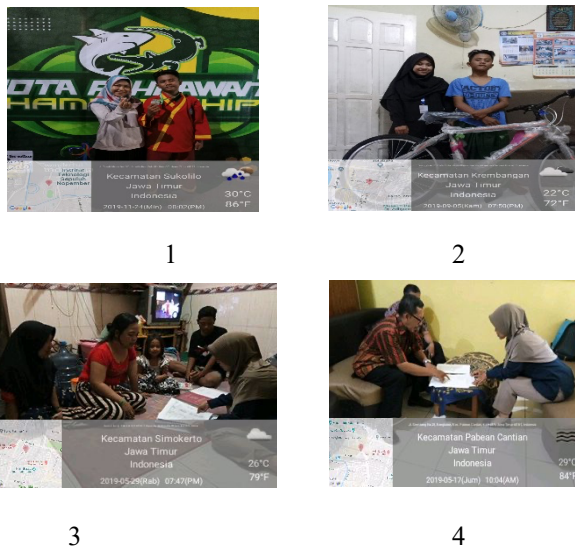
Gambar 2. 1. Mahasiswa mendampingi adik damping yang mendapatkan juara 2 Tapak Suci tingkat nasional. 2. Bantuan sepeda untuk adik damping, 3. Mahasiswa melakukan komunikasi dengan keluarga adik damping. 4. Mahasiswa membantu pengurusan sekolah/pendidikan adik damping.

Selain melakukan berbagai program pendampingan pendidikan dan bantuan sosial kepada adik damping, tim CSR universitas Muhammadiyah Surabaya juga membuat karya dokumentasi berbentuk video. Karya yang berupa video, telah diunggah di kanal youtube. Dua diantaranya ada pada gambar 3