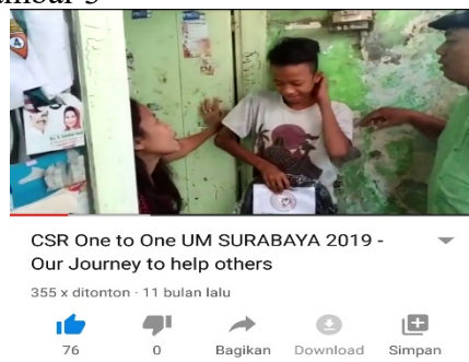
Gambar 3. Dokumentasi kegiatan program CSR one to one di kanal Youtube

Selain melakukan berbagai program pendampingan pendidikan dan bantuan sosial kepada adik damping, tim CSR universitas Muhammadiyah Surabaya juga membuat karya dokumentasi berbentuk video. Karya yang berupa video, telah diunggah di kanal youtube. Dua diantaranya ada pada gambar 3