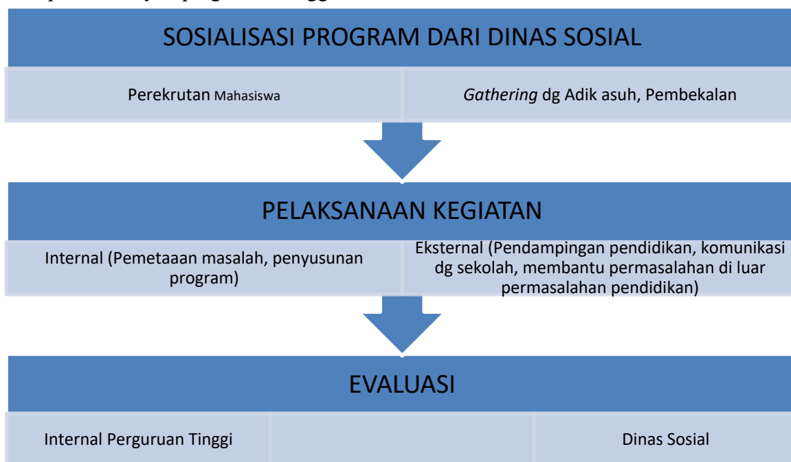
Gambar 1. Alur pelaksanaan program CSR

melakukan perekrutan mahasiswa dari berbagai fakultas yang ada di perguruan tinggi. Di Universitas Muhammadiyah Surabaya, mahasiswa yang tergabung dalam program CSR berasal dari 3 fakultas_FKIP, Fakultas Ekonomis dan Bisnis, dan Fakultas Psikologi. Alur proses pelaksanaan program CSR bisa dilihat pada gambar dibawah ini :