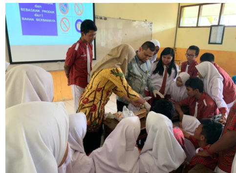
Gambar 2. Pengujian Kandungan Formalin/Boraks

Kegiatan demonstrasi deteksi formalin dan boraks melibatkan Dosen Program Studi Teknologi Pangan Universitas Muhammadiyah Malang. Beberapa jenis jajanan yang dijual di kantin diuji dengan kit boraks dan formalin dilakukan