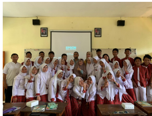
Gambar 1. Peneliti bersama pemateri, guru dan responden

responden diminta mengisi kuisisioner pretest sebagai alat untuk mendaftarkan tingkat pengetahuan awal. Pemberian materi berlangsung secara interaktif yang ditunjukkan dengan banyaknya pertanyaan yang disampaikan oleh responden, hal ini menunjukkan bahwa responden tertarik dan antusias dengan topik pembahasan keamanan pangan. Selain itu, penjelasan materi menggunakan bahasa yang efektif untuk dipahami serta pemberian contoh yang berdekatan dengan kehidupan sehari-hari. Penyampaian materi dengan media Powerpoint yang interaktif dan didukung dengan pemateri yang komunikatif mampu mendapatkan perhatian yang bagus dari semua responden.