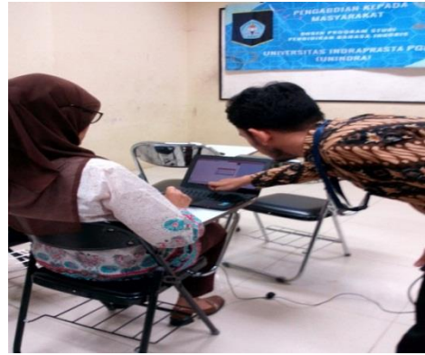
Gambar 3 Pemberian pengarahan kepada peserta

mempraktikkan kembali penggunaan mendeley secara komprehensif.