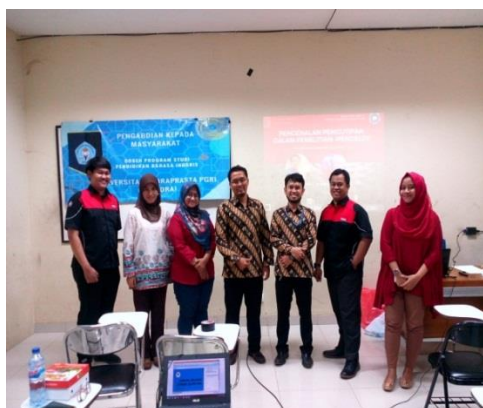
Gambar 4 Tim pelaksana dengan peserta pengabdian kepada masyarakat