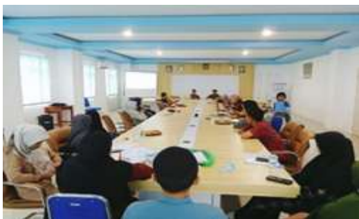
Gambar 3: Rapat tim persiapan Pengabdian Kepada Masyarakat

Tahap persiapan, yakni tim melakukan riset awal, kajian empiris dan konfirmasi mitra untuk mengetahui kondisi dan masalah yang terjadi pada objek dampingan. Selanjutnya tim pengabdian ini menentukan fokus dan mempertimbangkan kemampuan akses. Tim menyiapkan kerangka kegiatan dan waktu pelaksanaan sesuai kondisi peserta dan efektifitas kegiatan. Tim melakukan koordinasi dan mendapatkan kesepakatan dari pihak terkait yakni KBRI Kuala Lumpur, Sekolah Indonesia Kuala Lumpur (SIKL) dan pengelola Sanggar Bimbingan Sanggar Bimbingan SMP An Nahdloh Selangor Malaysia. Selanjutnya tim menyusun agenda teknis kegiatan dan keberangkatan, menyiapkan materi dan media presentasi Power Point yang dinilai penting bagi peserta.