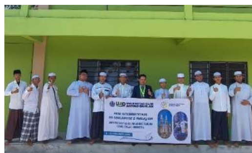
Gambar 8 & 9: Narasumber, tim PKM dan peserta di SMP An-Nahdloh Selangor Malaysia

Hasil pelaksanaan kegiatan menunjukkan santri/santriwati makin memahami dan menyadari pentingnya karakter integritas, identitas nasional dan budaya Indonesia yang beragam. Respon kegiatan ini juga menunjukkan pula bahwa Sanggar Bimbingan Belajar ini terus berupaya menumbuhkan karakter budaya bangsa. Karakter dalam konteks ini ialah kepribadian, jiwa dan hati, prilaku dan budi pekerti, personalitas, berperilaku, yang menjadi sifat, tabiat watak (Tatik, 2011). Hal ini juga menunjukkan bahwa penguatan karakter integritas diberbagai lembaga-lembaga pendidikan Indonesia telah mengalami perkembangan secara signifikan, (Umar et al., 2024).