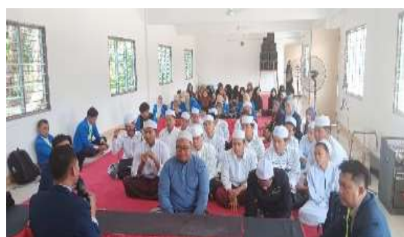
Gambar 7: Sharing dan diskusi integrasi nilai integritas dalam layanan pembelajaran pendidikan agama Islam

kebangsaan yakni gotong royong, toleransi antar sesama/umat beragama, patuh pada hukum yang berlaku, memperingati hari nasional/upacara bendera, memiliki dan menghargai budaya Indonesia, memahami budaya lain & budaya sendiri, (10). Mencintai tanah air merupakan bagian dari iman, (11). Mengamalkan sikap jujur dalam segala hal, mempelajari nilai-nilai kepedulian, kesabaran dan tanggung jawab, merasa bangga, setia dan selalu sadar pada budaya sendiri dan selalu menjadi contoh dan teladan dalam berbagai aspek kehidupan sesuai ajaran Islam. Selama penyajian materi juga berlangsung sharing dan tanya jawab antara peserta dan narasumber. Setelah itu berlangsung sesi diskusi bersama sejumlah pendidik/uztas terkait integrasi nilai karakter integritas nasional dalam pendidikan agama Islam. Adapun tahap akhir dilaksanakan berupa pemberian bantuan makanan bagi para santri dan santriwati.