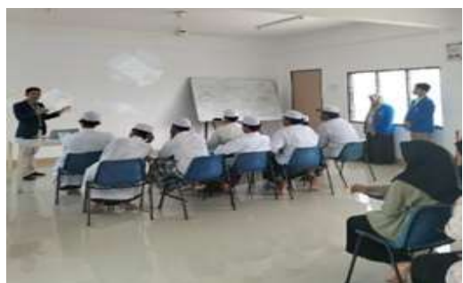
Gambar 5 & 6: Penyampaian materi, sharing dan diskusi

Adapun materi secara umum dijelaskan tentang: (1). Pendidikan nilai dan karakter bangsa menjadi fokus untuk membangun SDM unggul bangsa Indonesia, (2). Integritas kebangsaan sebagai kebutuhan mendasar dalam mewujudkan kualitas dan keunggulan sebuah bangsa, (3). Tantangan perubahan tata nilai kebangsaan yakni integritas rendah dan kepribadian yang terpecah ( split personality ), (4). Pendidikan Agama Islam merupakan potensi untuk membangun moral bangsa dan perilaku keberagamaan, (5). Budaya bangsa dan pentingnya integritas kebangsaan bagi peserta didik ketika menetap di negara lain, (6). Beradaptasi tanpa kehilangan jati diri kebangsaan, (7). Mengutamakan kepentingan bangsa diatas kepentingan pribadi, (8). Menghormati keberagamaan budaya dan agama, (9). Cara membangun integritas diri tentang