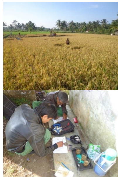
Gambar 3: Panen dengan metode ubinan (kiri) disertai pengamatan terhadap komponen hasil padi (kanan)

Hasil panen memperlihatkan bahwa dengan pemeliharaan intensif, produktivitas padi dengan kedua metode mencapai lebih dari 7 t/ha. Perbedaan hasil antara petak kontrol dan petak aplikasi pupuk hayati hanya 0,9 t/ha; setara dengan peningkatan produktivitas sebesar 1,25% (Tabel 1).