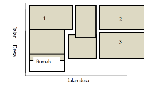
Gambar 2: Aplikasi pupuk hayati BION-UP dilakukan di plot no 1 dan 3 sedangkan plot 2 dijadikan kontrol tanpa pupuk hayati

Bibit ditanam dengan metode legowo dua-dua pada jarak tanam 20x20 cm antar bibit dan 30 cm (Babihoe, 2013), satu lubang ditanam 3-4 bibit. Pemupukan yang dilakukan pada plot perlakuan adalah: