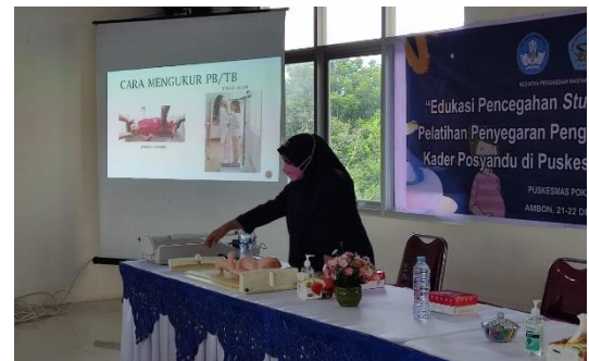
Gambar 1. Dokumentasi kegiatan pelatihan kader Posyandu Puskesmas Poka-Rumah Tiga, Kota Ambon

Kegiatan pelatihan ini dilaksanakan pada tanggal 22 Desember 2021. Kegiatan dihadiri oleh 30 kader dari 17 Posyandu (Taeno Atas, Taeno Bawah, Telaga Pange, Wailela Pantai, Kota Jawa, Denzipus, Gandaria, Dusun Bandari, Pohon Mangga, Wailela Atas, Rumah Tiga, Batu Tagepe, Poka Pantai, Batu Koneng, Air Ali, Hunuth, Tihu).