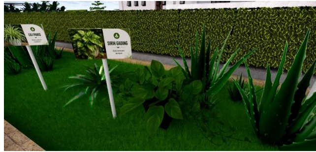
Gambar 7. Visualisasi Area Vegetasi Edukatif