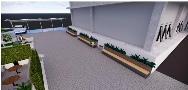
Gambar 4. Jalur Sirkulasi dan Area Vegetasi Linear di Sekitar Bangunan