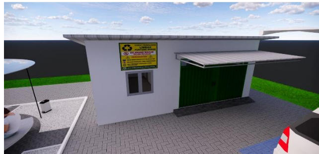
Gambar 8. Tempat Pengolahan Limbah Puntung Rokok