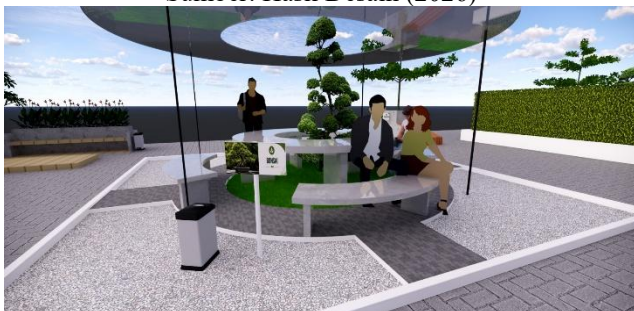
Gambar 5. Area Interaksi Edukatif