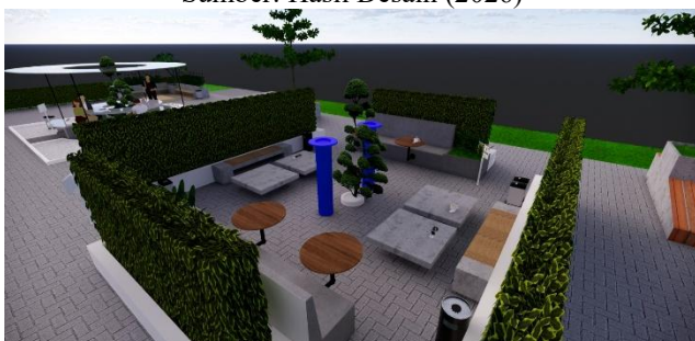
Gambar 6. Smart Smoking Area dengan Fasilitas Pendukung