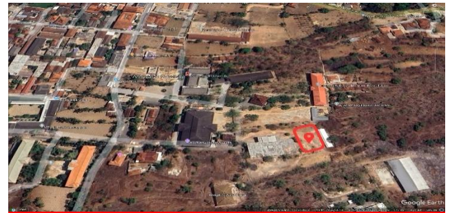
Gambar 1. Lokasi Taman Edukasi Dekarbonisasi dan Ruang Perokok Ramah Lingkungan

sebagai sarana pembelajaran dan pengelolaan limbah puntung rokok secara berkelanjutan.