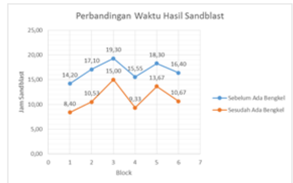
Gambar 2 Perbandingan Waktu Sandblast

Ditinjau dari grafik pada gambar 2 berdasarkan hasil perhitungan waktu sandblast sebelum ada bengkel blasting waktu terlama 19,30 jam. Waktu sandblast tercepat 14,20 jam. Kemudian untuk waktu rata-rata sandblast 16,81 jam. Dari hasil perhitungan waktu sandblast setelah ada bengkel blasting waktu terlama 15 jam. Waktu sandblast tercepat 8,4 jam. Kemudian untuk waktu rata-rata sandblast 11,27 jam.