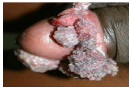
Gambar 11. Giant Kondilomata Akuminata (Natal E, 2006).

Tumor yang jarang pada anorektum dan genitalia eksterna yang berhubungan dengan HPV risiko rendah tipe 6 dan 11. Lesi berukuran besar, berbau tidak enak, massa seperti kembang kol, pertumbuhan lambat dan sering berulang. Lesi dapat menginfiltrasi dalam hingga jaringan di bawahnya dapat berkomplikasi menjadi fistul dan abses (Natal E, 2006).