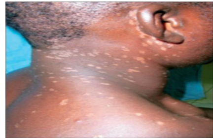
Gambar 8. Epidermodysplasia verruciformis (Levandowsky-Lutz) (Ostrow RS, Manias D, Mitchell AJ, 2007)

pi topikal seperti imiquimod atau cidofovir dapat dipertimbangkan (Ostrow RS, Manias D, Mitchell AJ, 2007).