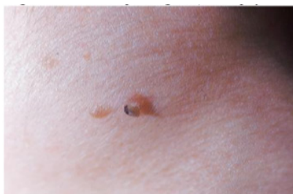
Gambar 3. Veruca Filiformis di leher (Cardosa J, Calonje E, 2011)