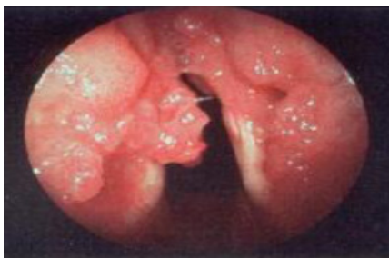
Gambar 13. Recurrent Respiratory Papillomatosis (Derkay C, Watrack B, 2009)

janin pada saat proses melahirkan, dan juga dapat terjadi pada janin masih di dalam kandungan melalui plasenta dan cairan amnion. Predileksi pada saluran respiratorius, area transformasi (dimana epitel berskuama dan epitel kolumnar bertemu) yakni laring. Gejala klinis adalah suara serak, batuk, wheezing, perubahan suara, dispnea kronik, tersedak, dan pingsan. Penyakit ini cukup berbahaya dan mengancam jiwa, karena pertumbuhan yang meluas sehingga menyebabkan obstruksi total saluran nafas. Pemeriksaan endoskopi cara menegaskan diagnosa. Terapi dapat menggunakan angiolitik laser atau dapat dikombinasikan dengan mikrodebridemen menggunakan cidofovir intralesi (Derkay C, Watrack B, 2009).