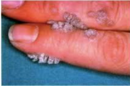
Gambar 7. Veruka Butcher's (Keefe M, Al-Ghamdi A, Conggon D, 2006)

Veruka ini lebih banyak akibat kerja. Pekerja pemotong daging, ayam, dan ikan. Memberikan gambaran klinis papul verukous yang meluas atau lesi seperti cauliflower pada punggung, telapak tangan dan tepi periungual pada tangan dan jari tangan. Serotipe yang sering menyebabkan adalah HPV tipe 7 dan HPV tipe 2 (Keefe M, Al-Ghamdi A, Conggon D, 2006).