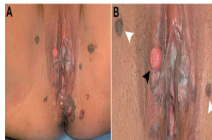
Gambar 12. Bowenoid papulosis pada vulva (Jones RW, Rowan DM, 2008)

Lesi berbentuk papul multi fokal pada genitalia dengan gambaran histologis seperti karsinoma in situ atau bowen disease . Gambaran klinisnya adalah papul berwarna kecoklatan atau papul yang eritematus yang letaknya di regio anogenital, predileksi pada dewasa muda yang seksual aktif. Gambaran klinisnya harus dibedakan dengan keratosis seboroik, nevus melanositik, dan veruka vulgaris. bowenoid papulosis sangat erat kaitannya dengan HPV tipe 16 (Jones RW, Rowan DM, 2008).