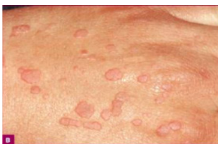
Gambar 4. Veruca Plana di tangan (Bacelieri R, Johnson M, 2007)

Lesi ini paling banyak di wajah, tangan bagian dorsum, bagian depan kaki dari lutut sampai mata kaki. Manifestasi klinis lesi dengan bentuk lentikuler, jumlahnya banyak terdiri dari papul dengan permukaan halus dan datar, papul kecil dengan peninggian yang jelas, berwarna abu-abu, kekuningan, atau dapat berwarna seperti kulit, diameter kurang dari 5 mm. Pada veruca plana ini dapat terjadi fenomena Koebner . Serotipe HPV tersering yang menyebabkan veruca plana ini adalah HPV tipe 3 dan 10. Penyembuhan lesi terkadang terjadi spontan, dan terkadang memiliki gejala gatal, dengan inflamasi di sekitarnya atau depigmentasi (Bacelieri R, Johnson M, 2007).