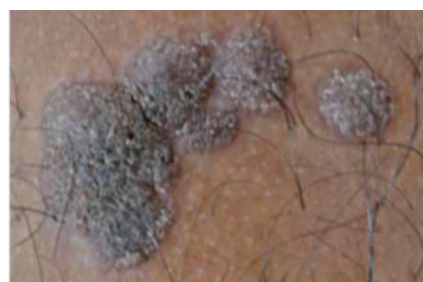
Gambar 6. Veruca Berpigmen (Gibbs S, Harvey I, Sterling J, Stark R, 2004)

Gambaran klinis veruca berpigmen adalah variasi warna yang bermacam-macam dari abu-abu hingga kecoklatan, dan gambaran histologis spesifik adanya badan inklusi yang homogen di sitoplasma. Terdapat peningkatan melanosom pada lesi. Veruca tipe ini berhubungan dengan HPV tipe 4, tipe 65 dan tipe 60. Veruca berpigmen merupakan lesi yang lebih keratinisasi, terapi yang terbaik dilakukan adalah eksisi (Gibbs S, Harvey I, Sterling J, Stark R, 2004).