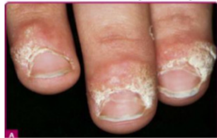
Gambar 2. Veruka vulgaris , di daerah periungual (Androphy JE, Kirnbaurer R, 2012)

Disebabkan oleh HPV tipe 1, 2, 4. Veruka vulgaris bersifat asimtomatis, hiperkeratosis, eksofitik, papul dan nodul berbentuk kubah, permukaan verukous, ukurannya lebih kecil dari 1mm hingga 10 mm (namun jarang sekali). Lokasi tersering ditemukan di tangan (terutama jari tangan), selain itu bisa terdapat di lutut, siku atau bagian tubuh lain yang terkena trauma. Veruka di periungual dapat terjadi di beberapa tempat, di sekitar tepi kuku, termasuk di proksimal nail fold dan hiponikium (Androphy JE, Kirnbaurer R, 2012).